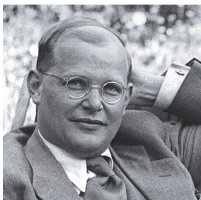
tekst van Dietrich Bonhoeffer (1906-1945)

Is moeizaam de draden losmaken en uit het spinrag der belevenissen loskomen en achterlaten en niet kunnen vergeten...