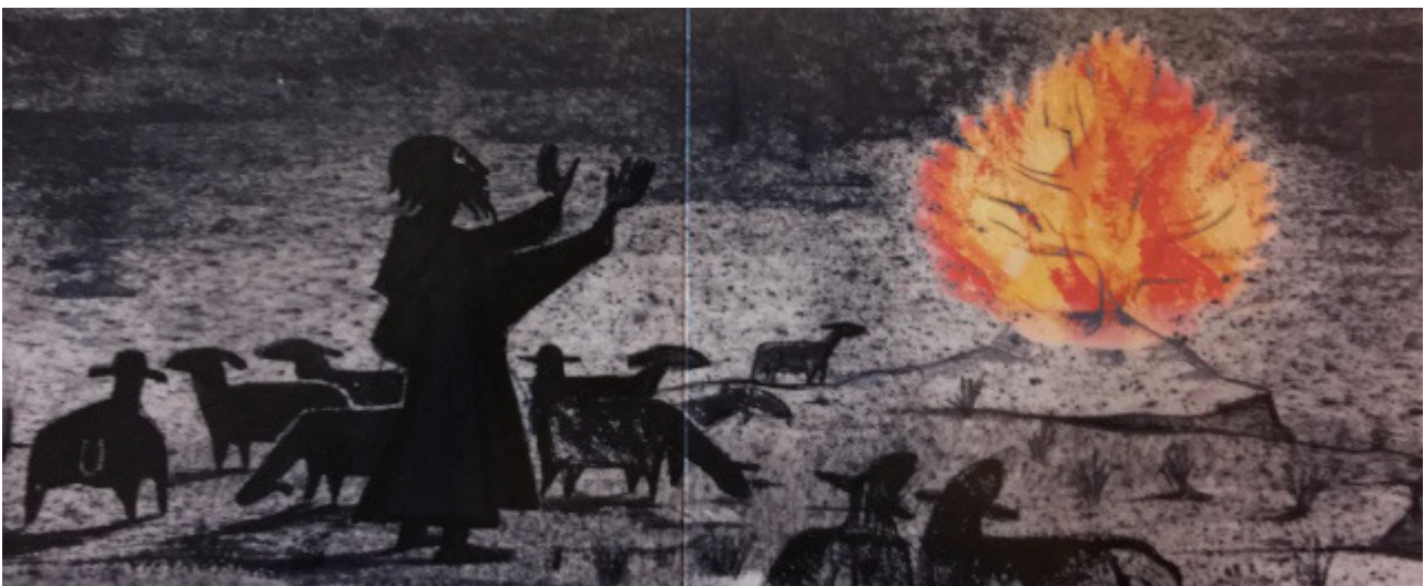
Egied noemde Brussel 'Het brandende braambos van Gods tegenwoordigheid'. (redactie BB)

Roel Venderbos, predikant en geestelijk verzorger in een verpleeghuis