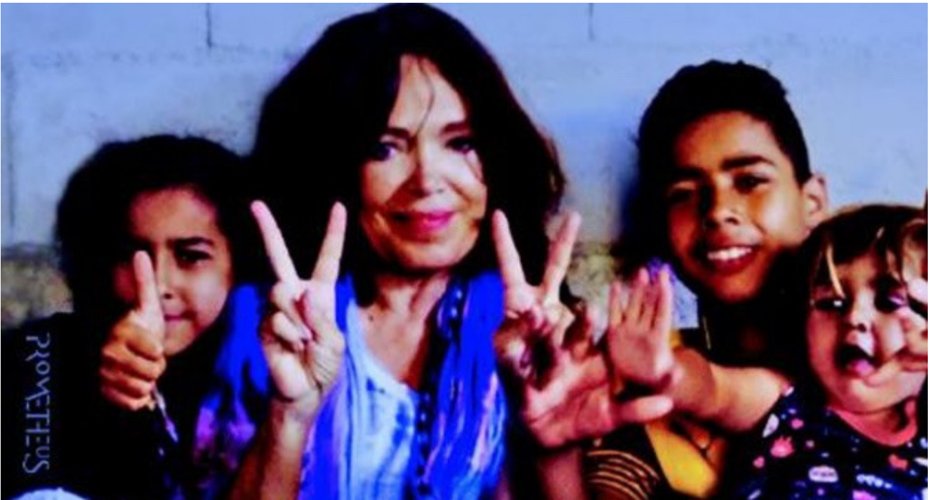
ingebracht door Bert Boxtart